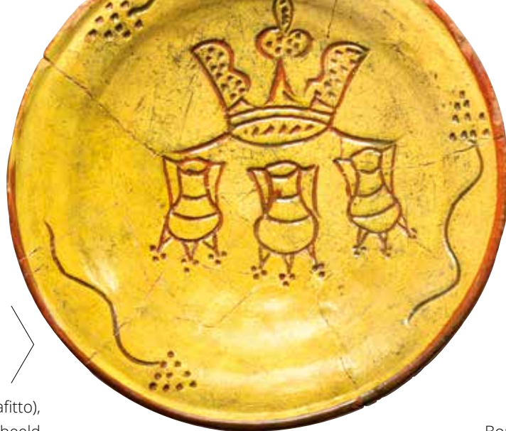
Bord van rood aardewerk ('s grafitto), gemaakt tussen 1450 en 1525. Afgebeeld zijn 3 gekroonde grappen (kookpotten). Vindplaats: Tolbrugstraat-waterzijde (1970).