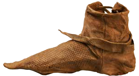
Fraai bewerkt leren kinderschoentje, ca. 1400. Vindplaats: uit Dordrecht, locatie helaas onbekend.